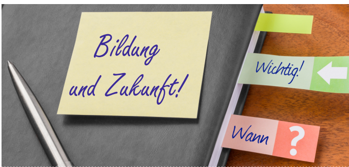
BILDUNGS- UND ZUKUNFTSFONDS