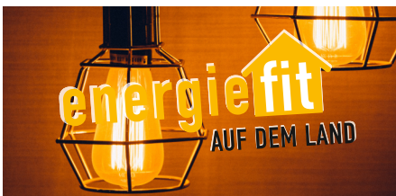
energiefit - AUF DEM LAND